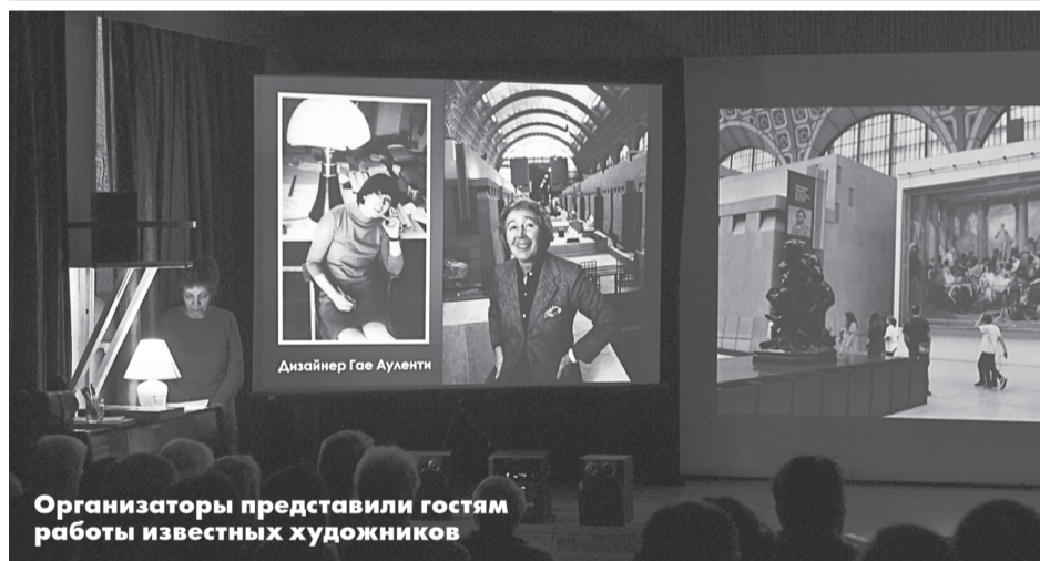
Организаторы представили гостям работы известных художников