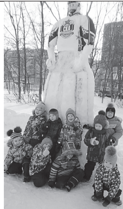
В номинации «Самый высокий снеговик» выиграл «Хоккеист» средней группы «Пчелки» детского сада № 127