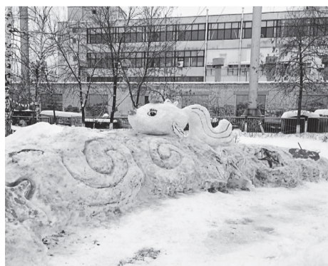
«Лучшее художественное исполнение»